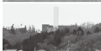
心配される煙突からの放射能飛散