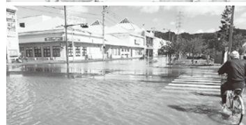
巨大化する風水害の防災が重要に