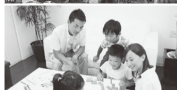
子育て環境の充実で魅力ある町に