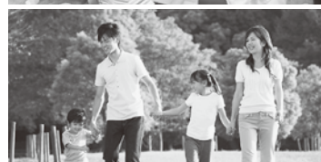
身近な公園の美化で憩いと潤いの町に